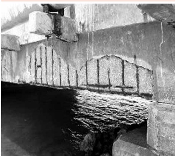
Foto 3: Desprendimiento del recubrimiento y pérdida de sección de la barra de acero