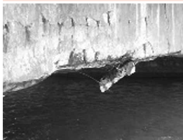
Foto 2: Desprendimiento del Recubrimiento inferior por corrosión de la barra.