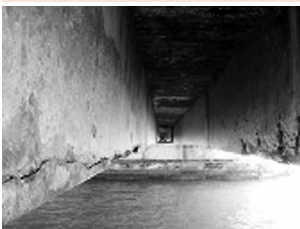
Foto 1: Manifestación del primer síntoma de corrosión de la barra de acero en las vigas