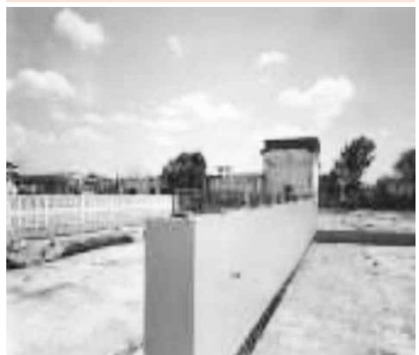
Foto 5: Producción de las vigas prefabricadas con la dosificación resultante