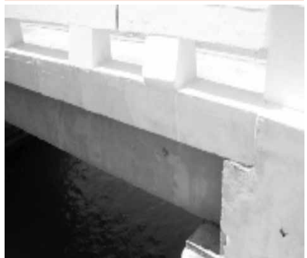
Foto 6: Colocación de las vigas prefabricadas en el puente correspondiente